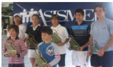
Campeones y finalistas